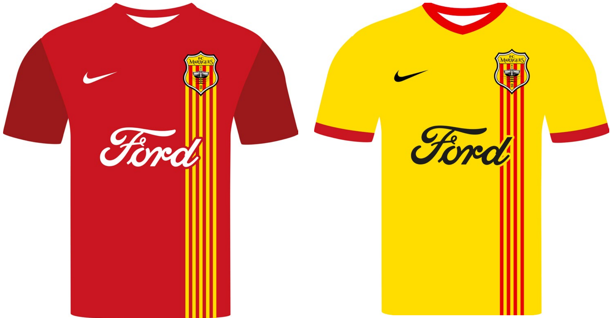
PROPOSITIONS DE MAILLOTS